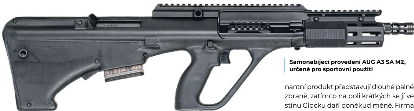
Samonabíjecí provedení AUG A3 SA M2, určené pro sportovní použití

nantní produkt představují dlouhé palné zbraně, zatímco na poli krátkých se jí ve stínu Glocku daří poněkud méně. Firma má většinu své moderní výrobní základny v Evropě.