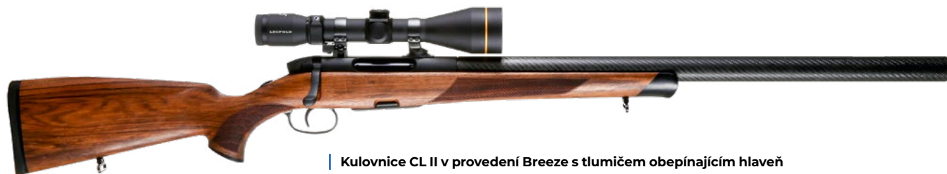
Kulovnice CL II v provedení Breeze s tlumičem obepínajícím hlavěň

Co jsme zde uvedli, platí především pro evropský trh. Nabídka Steyr Arms pro Ameriku je osekána v segmentu loveckých kulovnic a chybí tam vy-