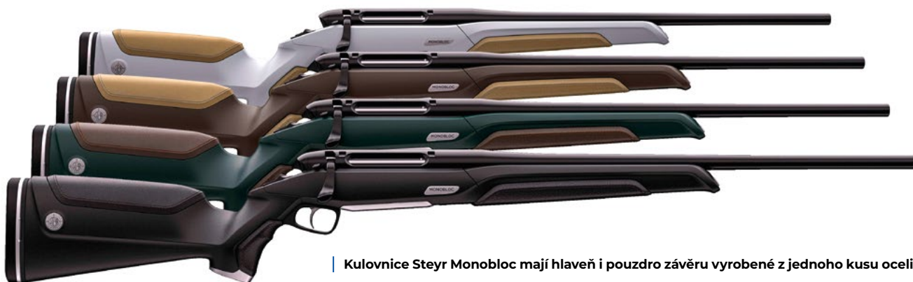
Kulovnice Steyr Monobloc mají hlavěň i pouzdro závěru vyrobené z jednoho kusu oceli

Firma vyrábí také malorážky Zephyr na náboje 17 HMR, 22 Long Rifle a 22 WMR. Brokovnice firma zkoušela naposled v roce 2011 modelem Duett, což byla broková kozlice. Velký úspěch se však nedostavil. ■