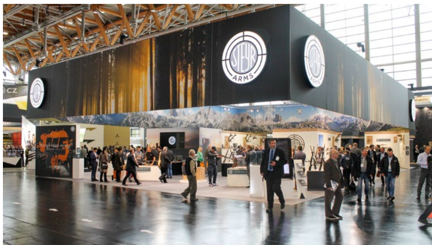
Rozsáhlá expozice Steyr Arms na veletrhu IWA 2019. Firma se tehdy velkolepě prezentovala pod novým názvem.

Nákupy dalších a dalších zbrojovek a značek českými firmami jsou pomalu na denním pořádku. V čele tohoto trendu jde ambiciózní Czechoslovak Group, která jede skutečně impozantním tempem a jejíž akviziční činnost přeskočila Atlantik. Činí se ovšem i menší uskupení.