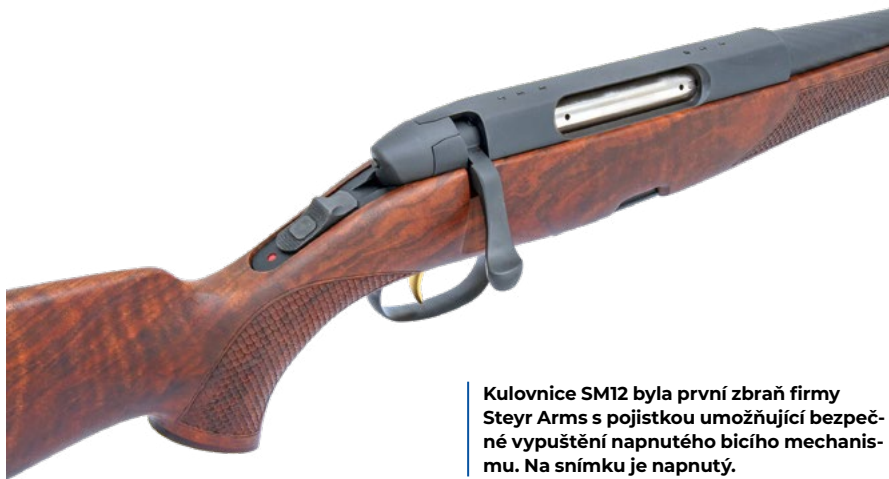
Kulovnice SM12 byla první zbraň firmy Steyr Arms s pojistkou umožňující bezpečné vypuštění napnutého bicího mechanismu. Na snímku je napnutý.

Takovou pojistku má model SM12 jako první zbraň firmy Steyr Arms. Posunem dopředu úderník napnete, posunem