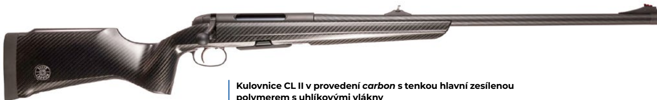
Kulovnice CL II v provedení carbon s tenkou hlavní zesílenou polymerem s uhlíkovými vlákny

myšlenosti jako Carbon, Breeze nebo Gams. Naopak nabídka AUG a jejich klonů je do Ameriky překlápána celá.