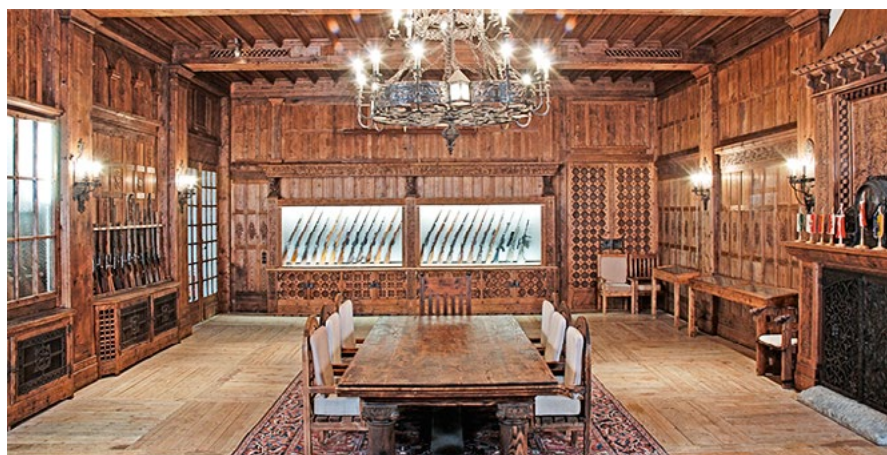
Proslulý ručně vyrobený Waffensaal byl údajně postaven v roce 1915 v původní správní budově firmy ve Steyru a nakonec přestěhován kus po kuse do Kleinramingu. Obsahuje prý kompletní sbírku typů zbraní vyráběných firmou od roku 1800.

Co vlastně česká skupina v Rakousku a Americe koupila? Především značku, která má ve světě dobrý zvuk. Domi-