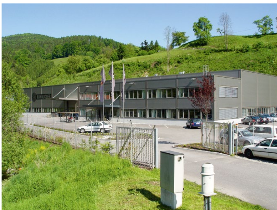
Objekt Steyr Arms v Kleinramingu je moderní stavba. Fotografie pochází ještě z doby, kdy se firma jmenovala Steyr Mannlicher.

vedení firem Heckler & Koch či Carl Zeiss Sports Optics.