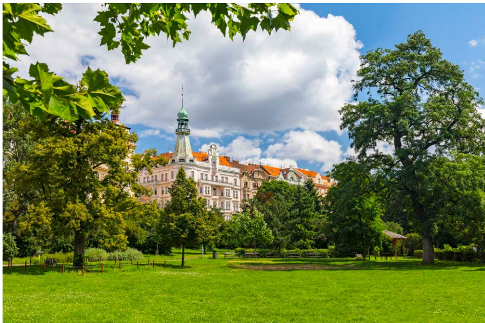
Rezidence Norská nabízí luxusní ubytování na pomezí pražských Vinohrad v Praze 10

Dění na realitním trhu stále výrazně ovlivňují vysoké úrokové sazby hypoték, které se už několik měsíců drží kolem 6 %. Složitá situace ale jako by obešla segment prémiových nemovitostí. Zájem o ně je vysoký. Potvrzuje to například projekt Rezidence Norská, který nabízí luxusní byty v nově rekonstruované nárožní secesní budově přímo u Heroldových sadů v Praze 10. Za dva týdny od zařazení na trh je zde v rezervaci nebo s uzavřenou smlouvou více než 20 % bytů.